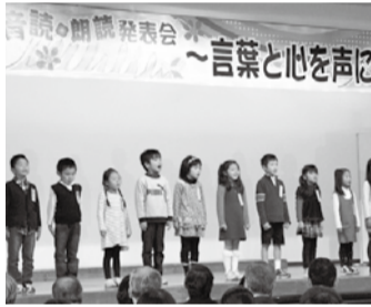
昨年12月1日に行われた「第7回音読・朗読発表会」

▷活動期間=5月～12月※5回の実行委員会を予定(第1回実行委員会は、5月25日(土)13時30分から中央図書館で開催) ▷活動内容=発表会の準備、当日の運営など 対 市内在住・在勤・在学の方 申 同会事務局(中央図書館内)へ5月21日までに電話 問 中央図書館 ☎7159-4646