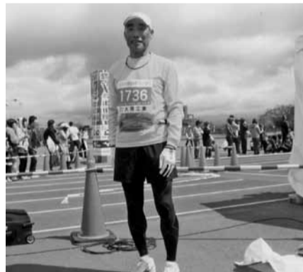
加賀温泉郷マラソン大会にて。悪天候にもかかわらず目標の3時間台をクリア

67歳になった今も、週に3回の10キロ走を欠かさず、月に数回は20キロも走る。フルマラソンにも挑戦していて、60歳手前で出した3時間25分が記録だという。3時間台で走ることを目標に、年に10回は全国のマラソン大会に出場する。4月21日には石川県で行われた加賀温泉郷マラソン大会にも参加したばかり。「全国の大会に出場するのは、ついでに近くを旅行するのも楽しみなんです」と目を細める。