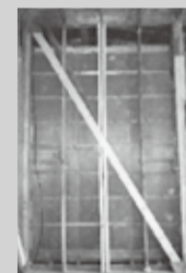
壁に筋交いを追加して補強した耐震改修の例