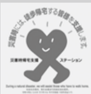
千葉県を含む九都県市が協定を締結