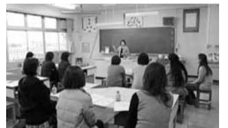
「まちの先生」を活用して行われた小学校PTAの講演会

市では、学術・文化芸術、スポーツ、医療・福祉、人権擁護や平和、消費者保護など、さまざまな分野(別表)で知識や経験、技能をお持ちの方に「まちの先生」として人材登録をいただいています。