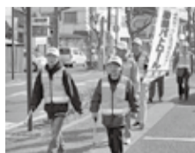
空き巣ゼロを目指し活動する自主防犯パトロール隊