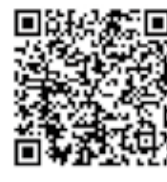
携帯電話から簡単に申し込み