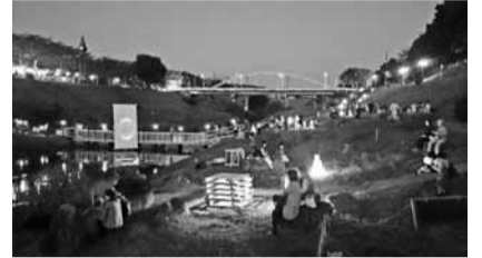
最優秀賞作品(スマートフォン部門) 「利根運河シアターナイト」