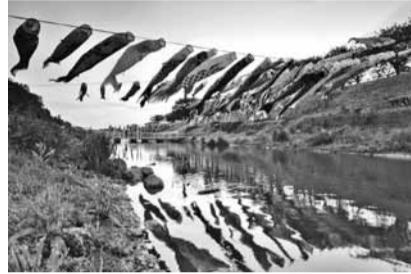
最優秀賞作品(カメラ部門) 「夕日に泳ぐ」