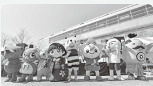
昨年出演したご当地キャラクター

産業博のキャラクター「ながれやまん」=写真(右)をはじめ千葉県下のご当地キャラ(8体以上出演)が行う東日本大震災復興チャリティーイベント。