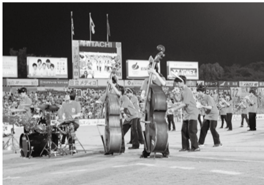
昨年は南部中の生徒が演奏

申往復ハガキに①住所②氏名③小学校名④学年⑤電話番号⑥招待希望枚数⑦購入希望枚数⑧今後レイソルの優待案内を希望する場合は「希望する」、返信用紙に宛名を明記の上、7月18日(必着)までに☎277-0083柏市日立台1-2-50(株)日立柏レイソル事業本部「流山ホームタウンデー」小学生招待企画係へ 問同事業本部 ☎7162-2250