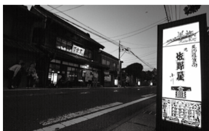
第2回流山市景観賞・まちづくり活動部門受賞「流山本町～行灯によるまちづくり」