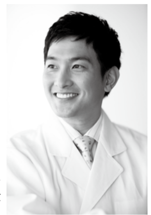
NHK「きょうの料理」講師、NHK大河ドラマ「龍馬伝」料理所作指導、TBSテレビ「渡る世間は鬼ばかり」の「おかくら」料理所作指導