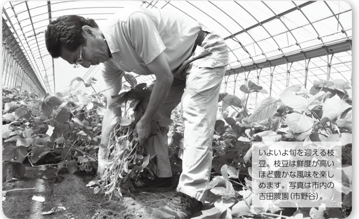
いよいよ旬を迎える枝豆。枝豆は鮮度が高いほど豊かな風味を楽しめます。写真は市内の吉田農園(市野谷)。

※市ホームページのトップページ左側「広報」のID検索ボックスに入力すると、すぐに関連ページが見られます。