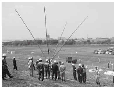
竹を利用して堤防の決壊を防ぐ「五徳縫い」

水防演習を開催しました。この演習は、2年に1回開催されており、今年度は流山市が幹事市として主催し、真夏を感じるほどの晴天の中、両市合わせて300人を超える水防団員や建設業協同組合員が参加し訓練を行いました。