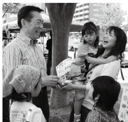
5月3日のグリーンフェスティバルで

6月5日、平成26年市議会第2 回定例会の冒頭、井崎市長は19項目 について市政の一般報告を行いました。 このページでは、そのうち主な ものを要約して紹介します。