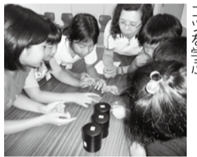
それぞれのプロから直接コツを学ぶ

定 各時間とも10~20人(先着順) 費 無料 申 会場内本部テントへ※受け付け済みの方にはホルダーを渡します。 問 マーケティング課 ☎7150-6308