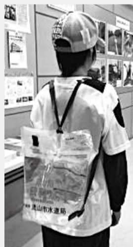
流山の応急給水用水袋はリュック型