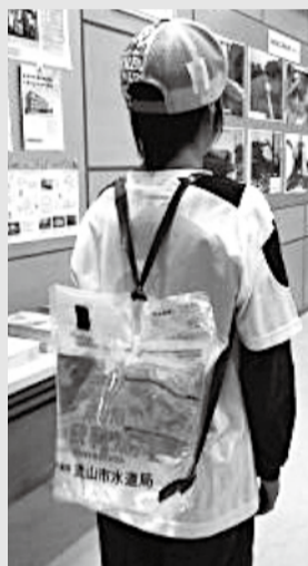
リュックにもなる応急給水用水袋