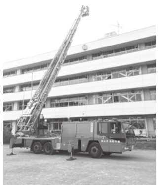
はしご車を活用した訓練も実施