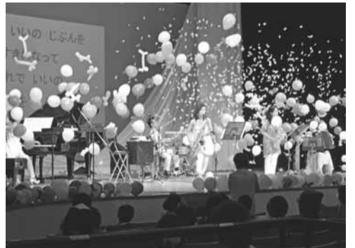
昨年のコンサートの様子