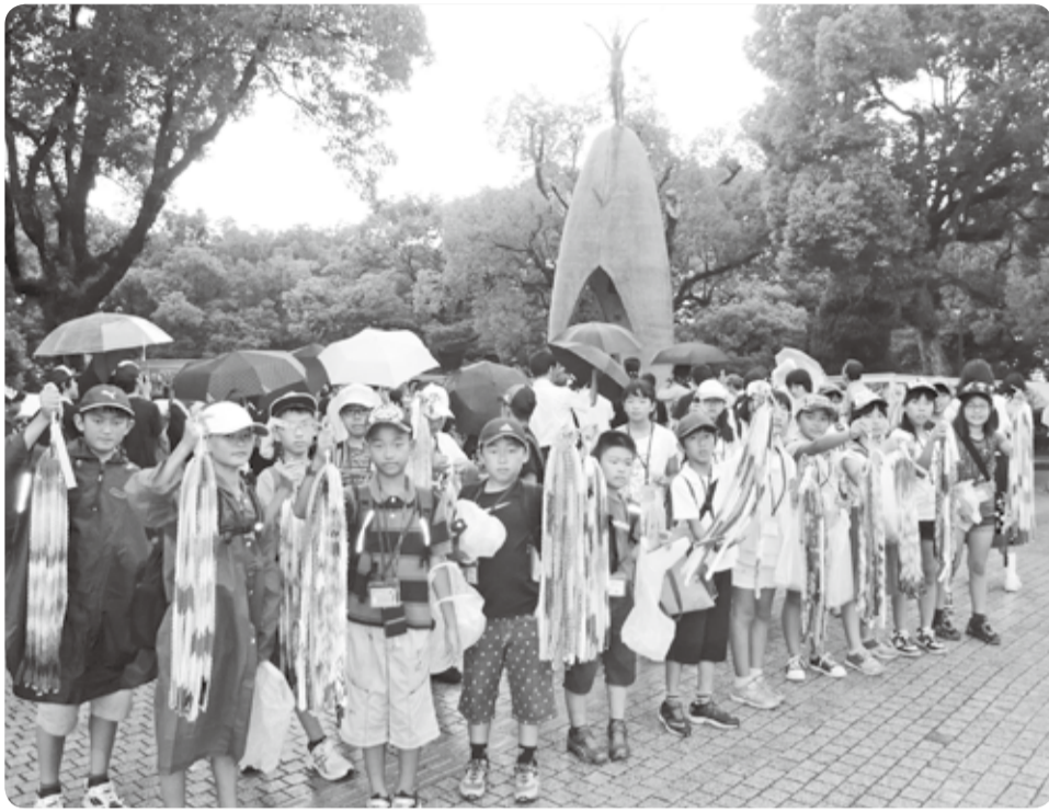
約22万羽の千羽鶴を広島へ届けた昨年の平和大使