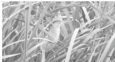
草の中のヨシゴイ

📅 5月10日(日) 9時~12時 所 利根運河交流館集合 定 小学生以上 定 20人(先着順) 費 300円(保険・資料代) 申 電話 問 利根運河交流館 ☎ 7153-8555 (月・火曜休館、祝日の場合は翌日)