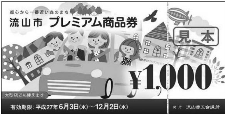
1,000円券は大型店を含むすべての対象店舗で使用できます ※いずれの券もおつりは出ません。