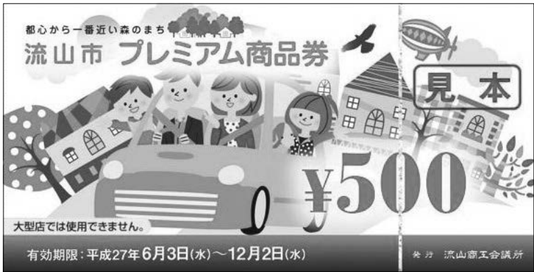
500円券は大型店では使用できません

引き換え期間中に完売とならなかった場合は、6月9日から流山商工会議所または市役所商工課で販売します。