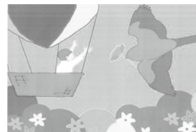
今年のステップアートデザイン