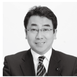
武田正光氏(現職・3期)

4月12日、千葉県議会議員一般選挙「流山市選挙区(定数2)」が行われ、即日開票の結果、本市選出の県議会議員に武田正光氏(45)と小宮清子氏(64)が当選しました。今回の選挙の投票率は36.83パーセントでした(前回は無投票)。