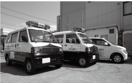
パトロールで使用する青色回転灯車両