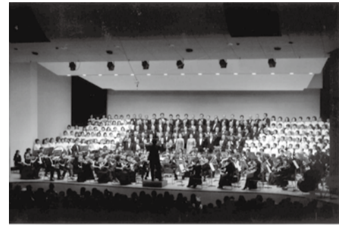
市制施行40周年を記念して開催した第九演奏会

事前の練習では、流山市合唱連盟と流山市音楽家協会が合唱指導を行います。楽譜の読み方が分からない方への指導もありますので、初めての方もぜひご参加ください。一緒に演奏会を作り上げましょう。当日は第九の合唱のほか、流山フィルハーモニー交響楽団によるオーケストラ演奏や、流山市民の歌の合唱も予定しています。