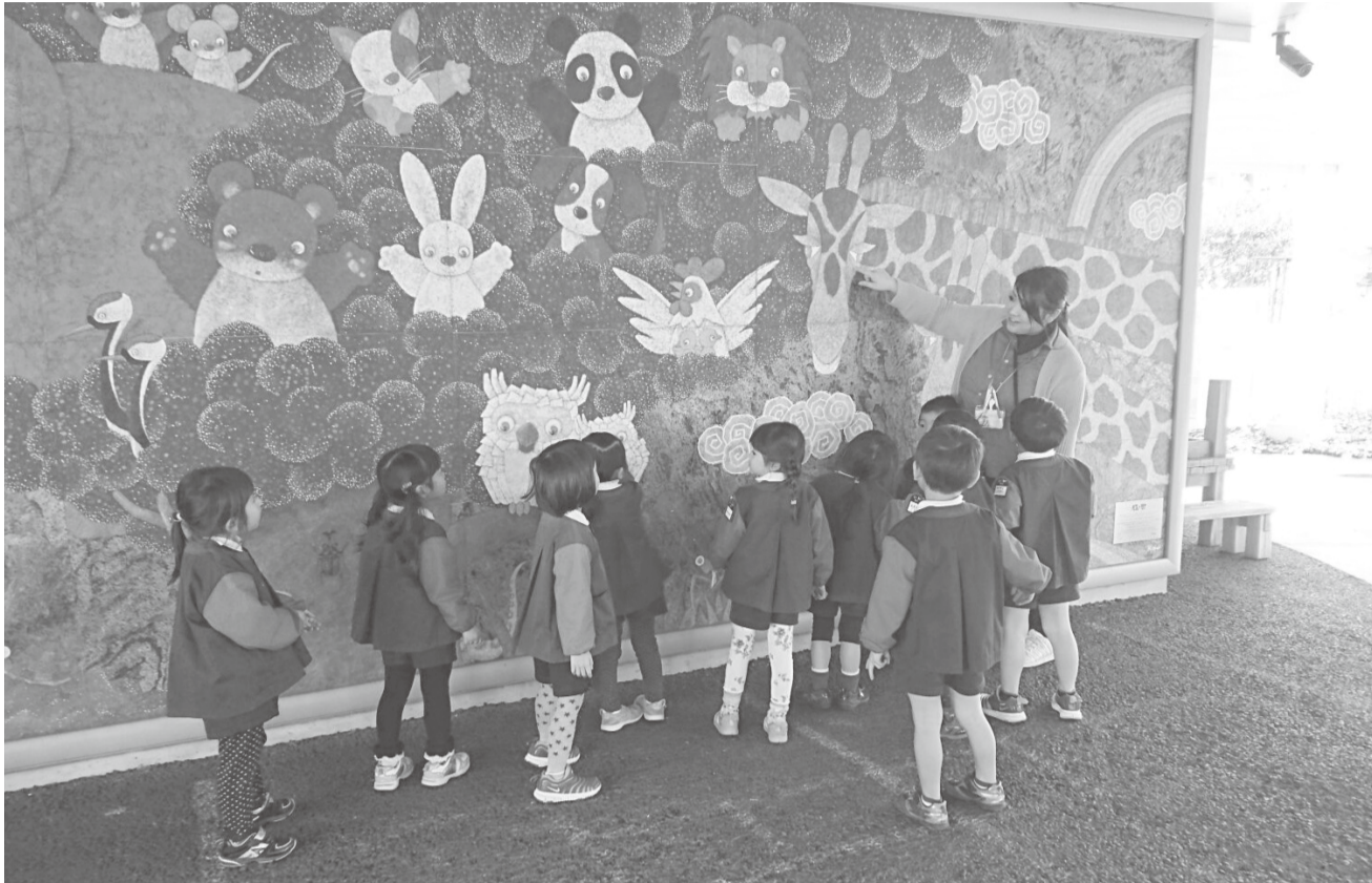
おおたかの森ナーサリースクールの保育の様子