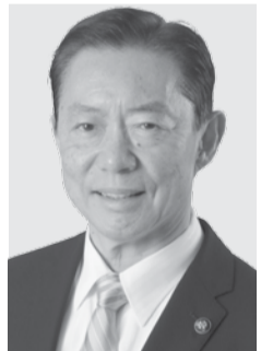
流山市長 井崎 義治