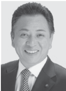
流山市議会議長 海老原 功一