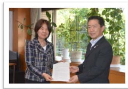
流山市男女共同参画審議会会長から流山市長へ答申書が手渡されました。