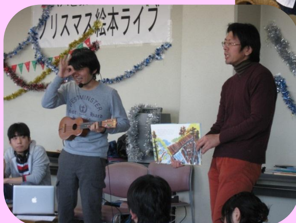
潜入！パパスクール流山