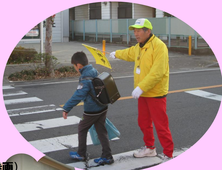
(男性の育児への参画)