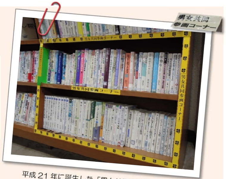
平成 21 年に誕生した「男女共同参画コーナー」