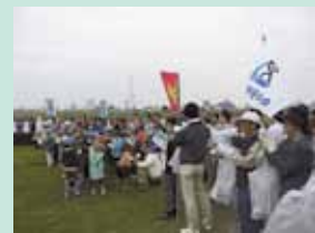
江戸川クリーン大作戦

Let's protect the clear stream in Edogawa