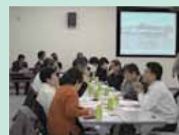
河川美化推進員会議