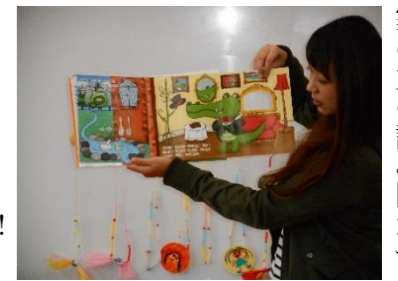
お家の方の読み聞かせ