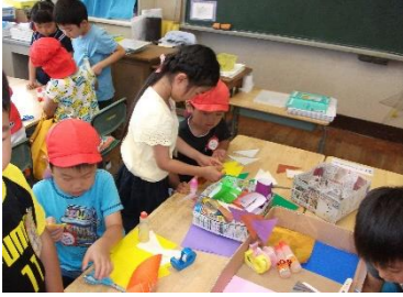
小学生に教えてもらったよ!