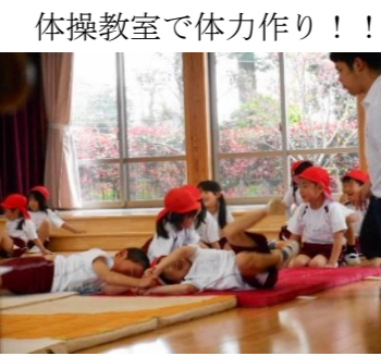
体操教室で体力作り!!