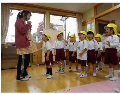
毎日ワクワクがいっぱい!

☆小学校・保育所との連携や、異年齢の友だち・地域の方々と触れ合う良さを感じることで、優しさを育み温もりのある人間関係を築きます。 ☆小学生や中学生に憧れ、自分を高めようとする意欲や自立心を育みます。