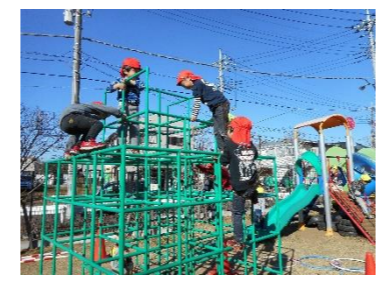
みんな友だち 園庭でのびのび遊んで健康な 身体をつくれます。