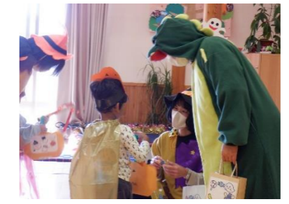
ハロウィンごっこ!