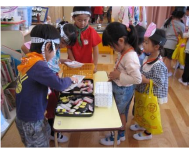
お店屋さんごっこや、じゃんけん列車で年長組さんが遊んでくれて、楽しいな!!