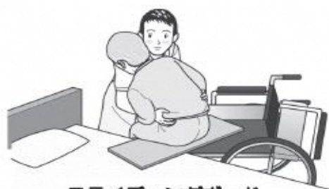
スライディングボード

対象者の体幹をやや前傾した状態で、左右交互に傾けて荷重を片側の臀部にかけ、次に荷重がかかっていない臀部の膝を車椅子背もたれ方向へ押すことで深く座ることができる。滑りにくい座面の場合は、片側のみスライディングシートを座面に敷き、同様に膝を押すことで滑りやすくなり深く座ることができる。