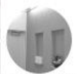
各階トイレの入り口も入りやすいです

改修工事によって、排泄は「恥ずかしい」「洋式でないからできない」「トイレは汚い・臭い・暗いから行きたくない」というイメージが払拭されてきています。