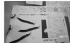
ナメクジ大研究3(東深井小)

2年連続の学校賞受賞は快挙です。11月12日、県総合教育センターで表彰式がありました。