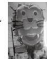
ガオガオライオン (長崎小)