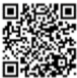
確定申告書等作成コーナー

また、「確定申告書作成コーナー(=二次元コード)」からパソコンやスマートフォンを使って確定申告書の作成や提出ができます。詳細は、国税庁ホームページをご覧ください。お近くの税務署にお問い合わせください。