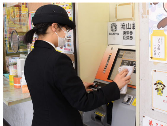
自動券売機などを定期的に消毒