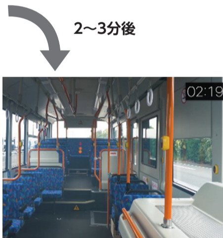
乗合バスや鉄道は換気装置により空気を入れ替え