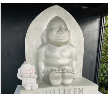
二代目利根運河ブリケンさん

ブリケンさんが誕生し、令和3年3月無事に利根運河の祠に納められました。これによって、流山の利根運河ブリケンさんは3体になり、この3体のブリケンさんが今後どんな活躍をしていくか楽しみにになりました。これまでも、初代利根運河ブリケンさんは、修復完了後、流山市観光協会の皆さんと一緒に、金色のブリケンさん寄贈のお礼の表敬訪問として大阪まで出張し、通天閣のブリケンさんと「足裏合わせ」をするなど幸福大使として活躍しました。平成31年に文化財保護法が改正され、保護の意味合いが強かったその内容から「文化財を活用しながら保存する」という新しい方向にかじを切ったこともあり、歴史を語る遺産が地元を飛び出して、他の地域とつながり、にぎわせる活躍を見せたことは、画期的な文化財の活用でもありました。