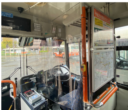
乗合バスの運転席脇にビニールシートを装着