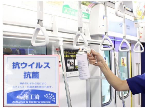
乗合バスや鉄道は手すりなどに抗ウイルス・抗菌加工