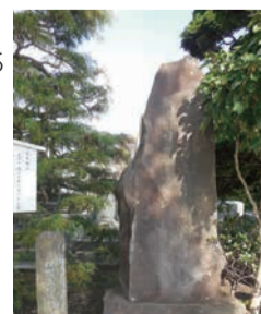
一茶・双樹連句碑(光明院)