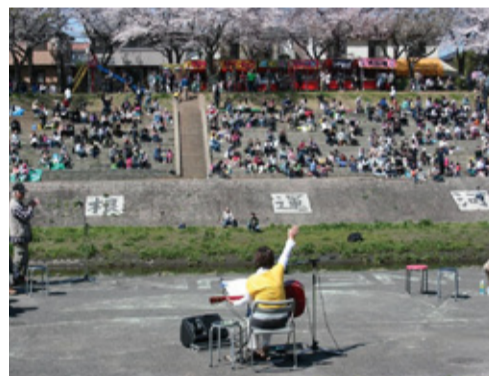
満開の桜の中で行われた「うんが いい! 朝市」ライブ (平成26年)

今後は、12月19日の運河駅ギャラリーでのアコースティックライブ、12月21日の