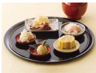
みりんを使ったおせち料理

新年を迎えるにあたり、江戸時代からの伝統を引き継ぐ、流山の白みりんを使ったおせち料理作りにご家族で挑戦してみたいかがでしょうか。ぜひ、みりんを使って、おいしいお正月をお楽しみください。