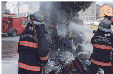
ごみ収集車で火災事故が発生

年末にかけてごみの搬入量が増加します。ごみは正しく分別して出していだくようご協力をお願いします。