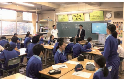
東深井中学校での授業風景

いじめのない環境づくりには、いじめ被害者や加害者のみならず、いじめを傍観する第三者の意識や取り組みも重要であり、同授業プログラムでは、生徒一人ひとりのいじめに対する意識を深め、日常の行動について考えることで、いじめ防止に努めていきます。