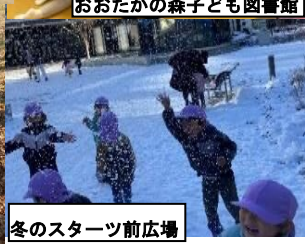
冬のスターツ前広場