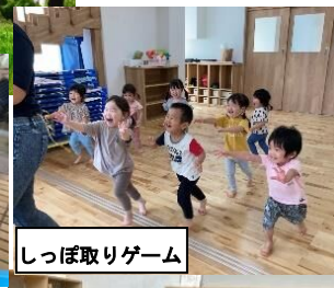
しっぽ取りゲーム