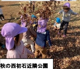
秋の西初石近隣公園