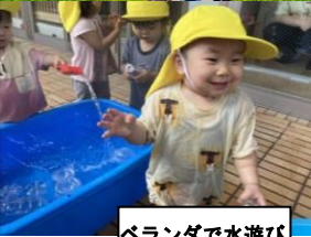
ベランダで水遊び