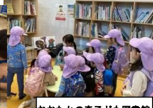
おおたかの森子ども図書館