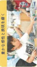
豊かな感性と表現を磨く

天気の良い日には、お散歩に出かけます。四季を感じながら自然の中で目だけでなく、匂い、音、感触など五感を使い感じることが大切になります。植物を育てたり、生き物を飼育することで愛着を感じたり命を大切にすることを学びます。