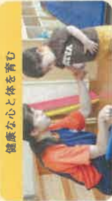
健康な心と体を育む