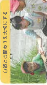
自然との関わりを大切に

元氣いっぱいばいばいで過ごす1日の中で、主体性を育む教育や保育をおこなっています。日々の遊びや体験を通じて、子どもたちの「できた」の数を増やしていきます。