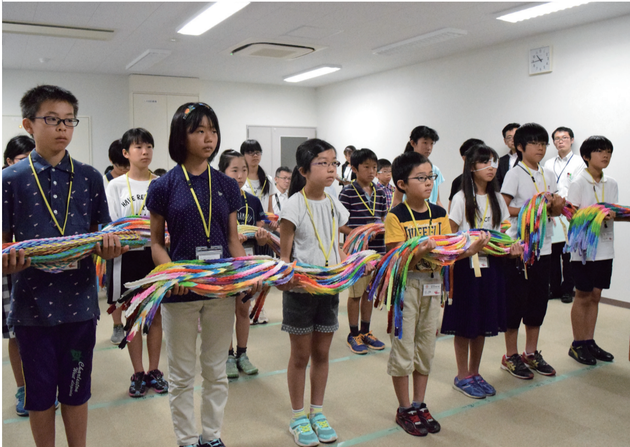
昨年、任命式で千羽鶴を受け取った平和大使の皆さん