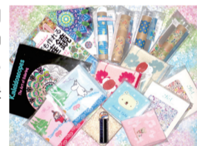
お楽しみくじ賞品の一例