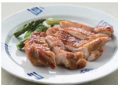
みりんを使った「鶏のてり焼き」

みりんはしょうゆのようには目立ちませんが、素材の味を引き立てるので、今では「隠し味の王様」とも呼ばれています。調理のあらゆるシーンで活躍できるからこそ、江戸時代から現代に至るまで、長年にわたり人々に親しまれているのです。