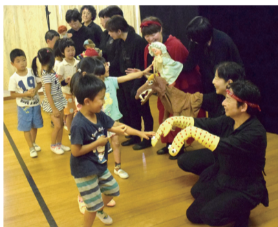
公演後、人形などを手に子どもたちとふれあいのひととき

7月20日には中央図書館で開催される「人形劇のつどい」に出演する(3面参照)。「子どもたちはもちろん、大人にもぜひ見て欲しい」と、会場で出会える笑顔を楽しみに練習に励む。