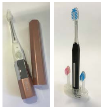
KISS YOU® IONPA