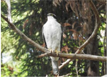
市内で撮影されたオオタカ