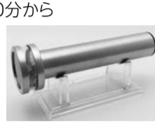
※台座はつきません