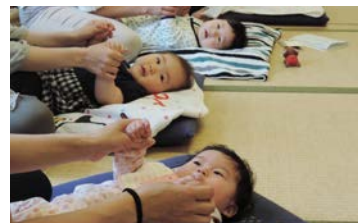
ベビーマッサージでスキンシップ