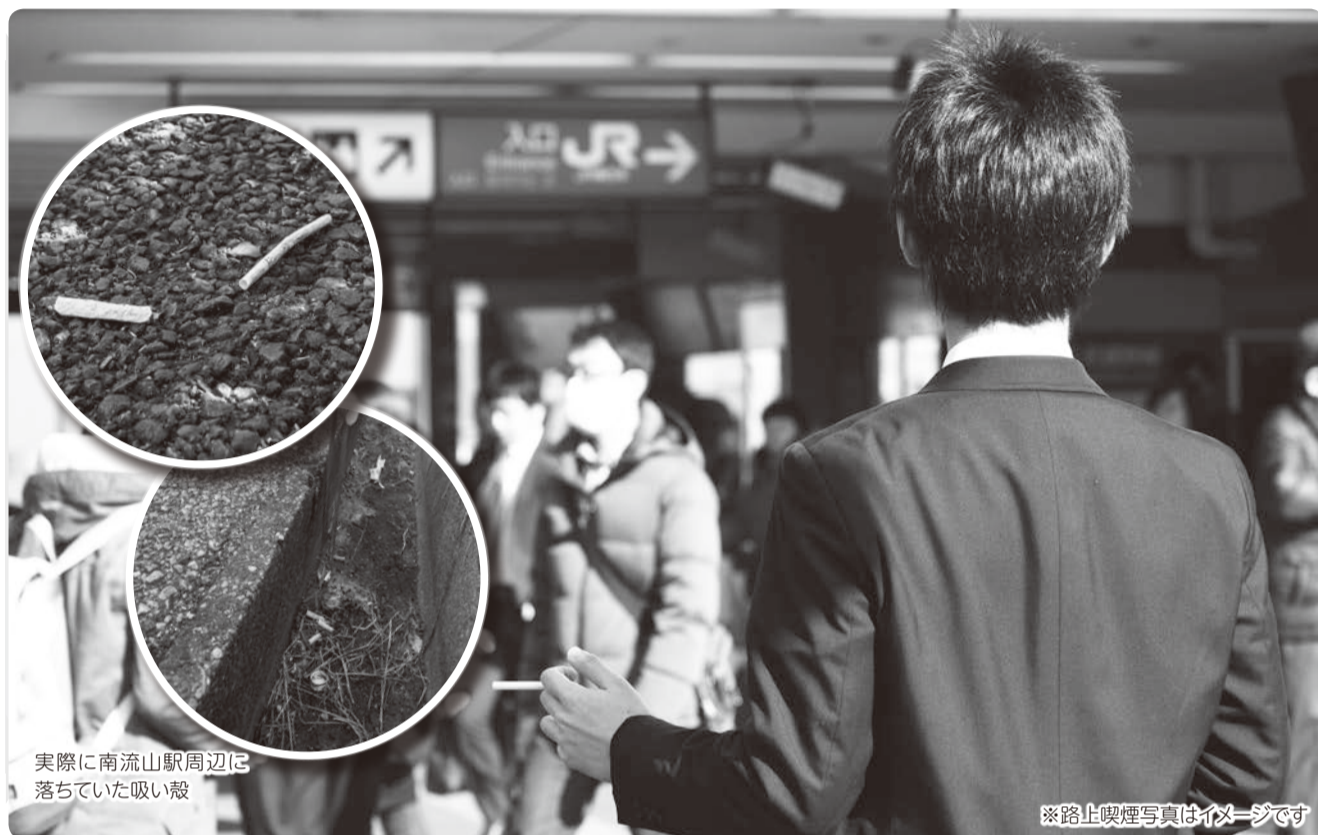
実際に南流山駅周辺に落ちていた吸い殻