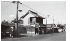
流山本町の広小路にあった庵書房出版旧社屋(昭和40年代後半撮影)

日3月10日(土)13時30分～15時 所流山福祉会館(見世蔵で受け付け) 定30人(先着順) 費500円(資料・お茶代) 申見世蔵に電話、ファクスまたはメール