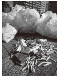
ごみ袋からたばこに関するごみを取り出してみました(一部)

グリーンボランティア「まちをきれいに志隊」の皆さんの清掃活動に密着しました。取材日(1月12日)は6人の方が約1時間、南流山駅周辺を一回り。年末にも活動をされたそうですが、吸い殻やたばこの空き箱、ライターなど喫煙に関するものが大量に落ちていました。排水溝に落ちていて拾えないものもたくさんありました。一人の「たった1回」がこれだけ街を汚してしまいます。あなたはマナーをしっかり守っていますか。