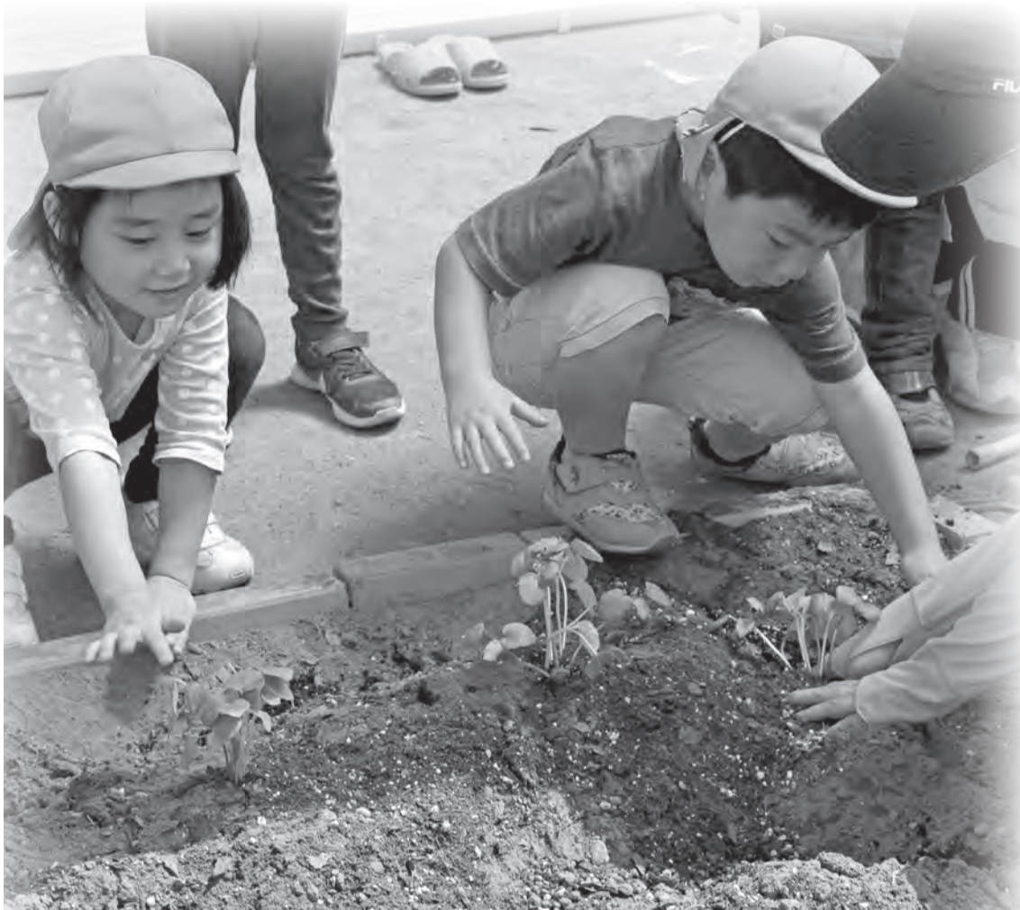
向小金保育所で野菜の苗を植える園児たち。 市立保育所では、5歳児クラスで食育のために、植え付けから収穫までの体験を保育活動に取り入れています。