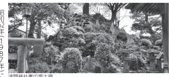
浅間神社裏の富士塚

明治25年(1892年)に完成したこの富士塚は、富士山の溶岩を江戸川で運んで造られた。ジグザクの参道に沿って一合目から九合目までを示す石造物などが建てられ、登り切ったところには富士浅間大神の碑がある。現在では大きな樹木や建物に囲まれているため、頂上よりも九合目付近から、はるか彼方に富士山を望むことができる。