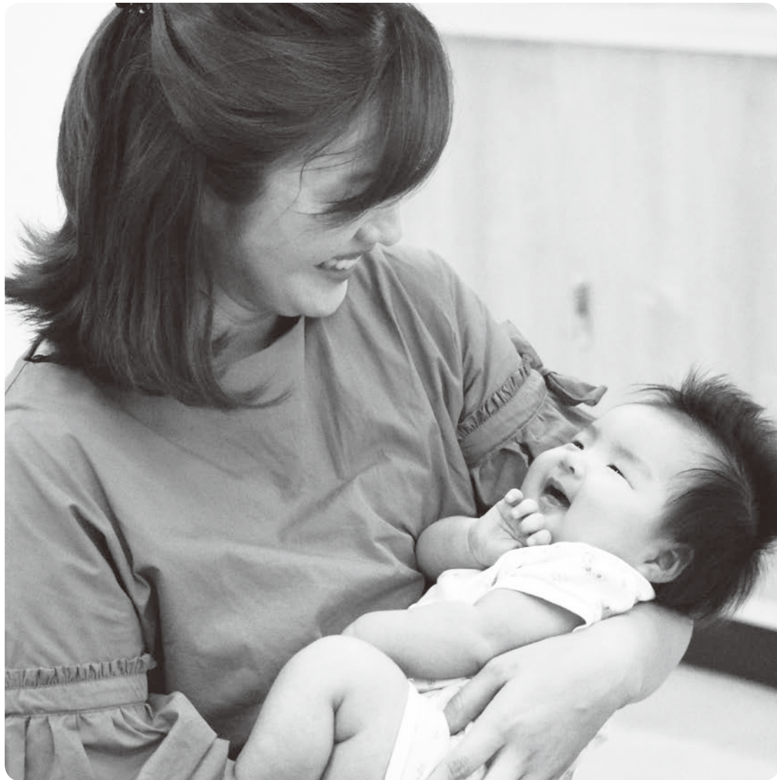
保健センターに健診や育児の相談に訪れたママと赤ちゃん。随時相談にお応えしていますので、お気軽にお越しください。ママの安心感は、赤ちゃんにも伝わります

流山市では、共働き世帯の方や転入されて間もない方が出産を迎えることが増えています。そのような妊産婦の方は、地域でのつながりがまだ少ないこともあって、妊娠や子育てに関する不安を自分一人で抱えてしまうことがあります。そのような不安を和らげるため、10月から保健センターに妊婦さん専用相談スペースを開設します。