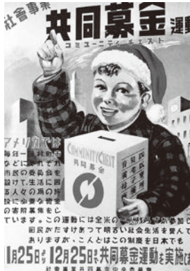
昭和22年のポスター