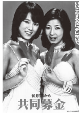
昭和53年のポスター