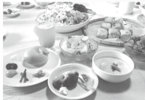
野菜たっぷりのおしゃれな昼食