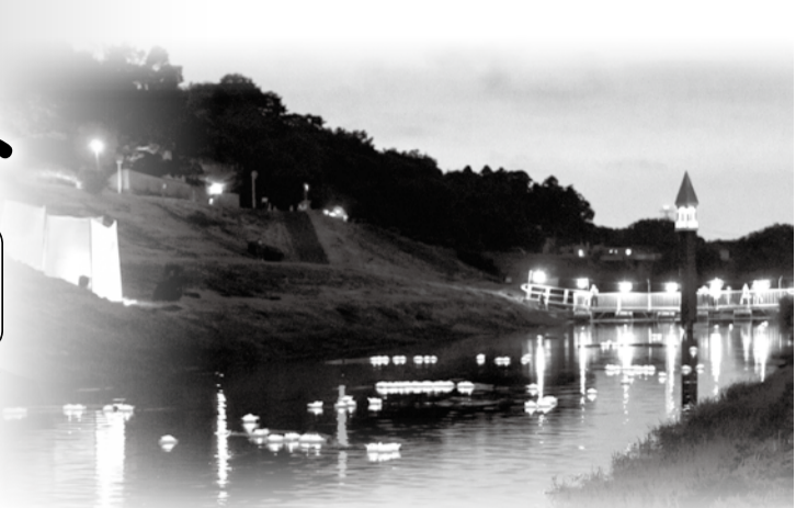
昨年のシアターナイト

たくさんの光のオブジェで彩られ、美しく水面が輝く非日常の利根運河を体験しませんか。 ☎利根運河交流館 ☎7153-8555 (月・火曜休館)