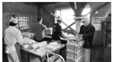
手賀沼せっけん工場の見学もあります