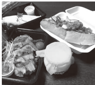
ブラスリーしんかわのメニュー

流山・松戸の人気店が、おいしいグルメを提供します。お酒のお供からメインディッシュ、デザートもあります。この日しか味わえないメニューも!今回は、4カ所のエリアで飲食が楽しめます。