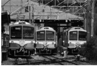
平成27年度入賞作品「100周年号発車」

〒市ホームページまたは流山市観光協会ホームページから 〒流山本町・利根運河ツーリズム推進課 ☎7168-1047 ID 31995