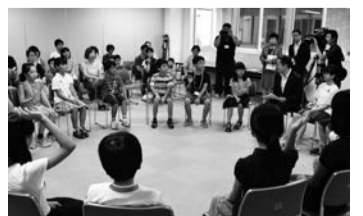
市役所で行われた報告会

平和大使の作文集は、市内全小・中学校に配布するほか、市ホームページや各公民館、各図書館、市役所情報公開コーナーなどでご覧になれます。