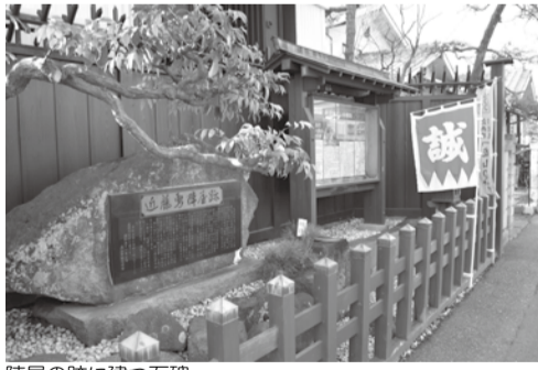
陣屋の跡に建つ石碑

慶応4年(1868年)、新選組は、鳥羽伏見で敗れ、綾瀬の五兵衛新田(現東京都足立区)に駐屯し再起を図っていた。旧暦4月1日、新政府軍が千住宿に迫った報を受け、その夜、一行は江戸川を渡り、未明に流山へ入った。当時大久保大和と名乗っていた近藤を含め、幹部は醸造業永岡三郎兵衛、方最後の本陣を敷き、その他の隊員たちは、光明院流山寺等の寺院に寄宿した。