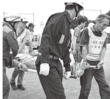
昨年行われた救護訓練

当日9時45分に、市全域に緊急地震速報の訓練放送を防災行政無線で流し、その場で安全行動をとるシェイクアウト訓練を実施します。放送が聞こえたら3つの安全行動(☑参照)をとり、自分の身を守るための行動を確認しましょう。総合防災訓練が中止の場合でも、シェイクアウト訓練は実施します。風や雨などで聞き取れなかった場合は、防災行政無線テレホンサービス(☎0120-778-3170)をご利用ください。