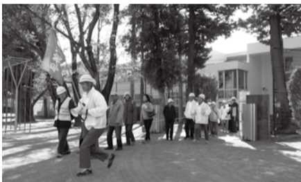
自主防災組織による避難誘導訓練

また、皆さんが安心して避難できるように、自主防災組織などでは避難所運営の体制づくりが行われています。