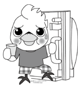
流山市けんしんPRキャラクター「ウケタカくん」

に保健センターへご相談ください。 日4月27日(水)～6月30日(木)のうち26日間 所保健センターや公民館など 内胃部X線撮影(バリウム造影) 対平成29年4月1日時点で40歳以上の方 費400円 問保健センター ☎7154-10331