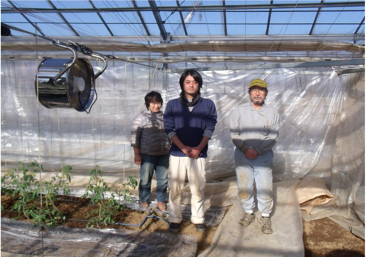
久兵衛農園株式会社のみなさん

平成26年1月1日 流山市農業委員会事務局 流山市平和台1-1-1 TEL 04-7150-6102