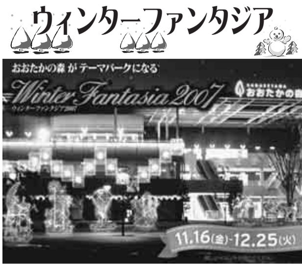
楽しいイベントが盛りだくさん

ファンタスティックなイルミネーションやパフォーマンスが、いっぱいのおおたかの森ウィンターファンタジア2007」が明日16日から開催されます。流山おおたかの森駅と周辺全体がテーマパークになったような楽しい企画がいっぱいです。