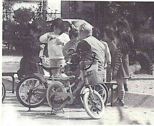
健やかな成長を願って...

三歳未満の児童を養育している方に「児童手当」を支給しています。手当の額は第一子と第二子が月額五千円、第三子以降が月額一万円です。申請月の翌月から支給します。ただし、所得が一定額以上の場合は、所得制限(下表)により児童手当は支給できません。