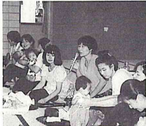
母親同士の交流も