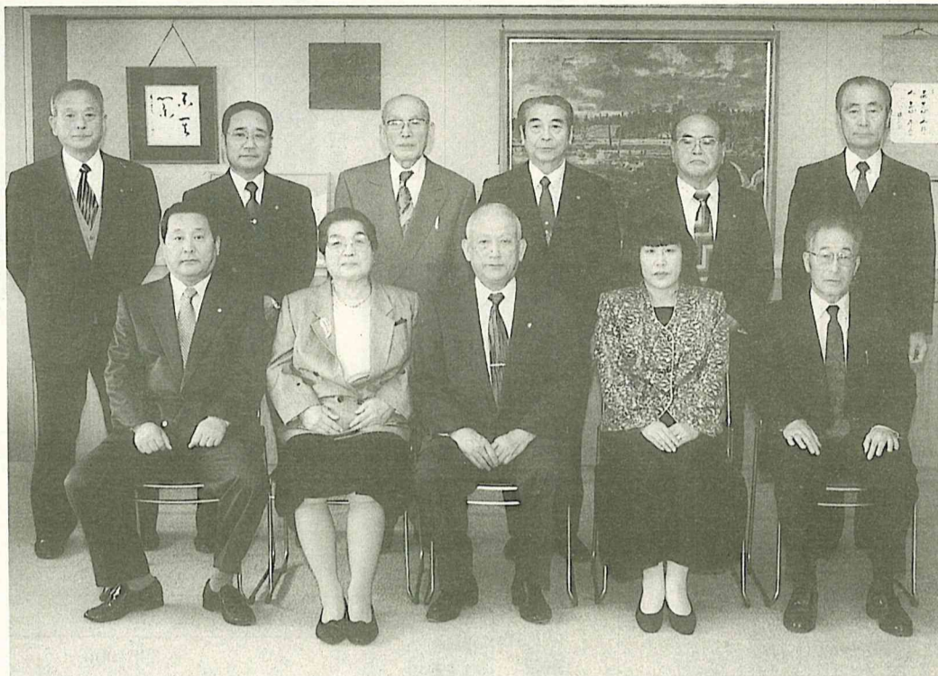
表彰式に出席した受賞者たち