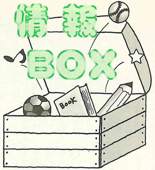
★印のあるものは市主催のもです