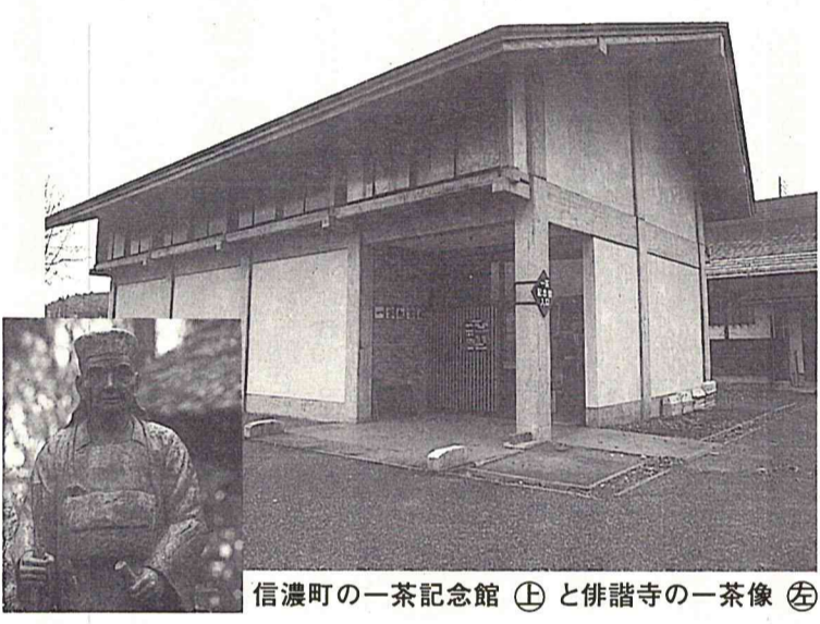
信濃町の一茶記念館 ㊤ と俳諧寺の一茶像 ㊦