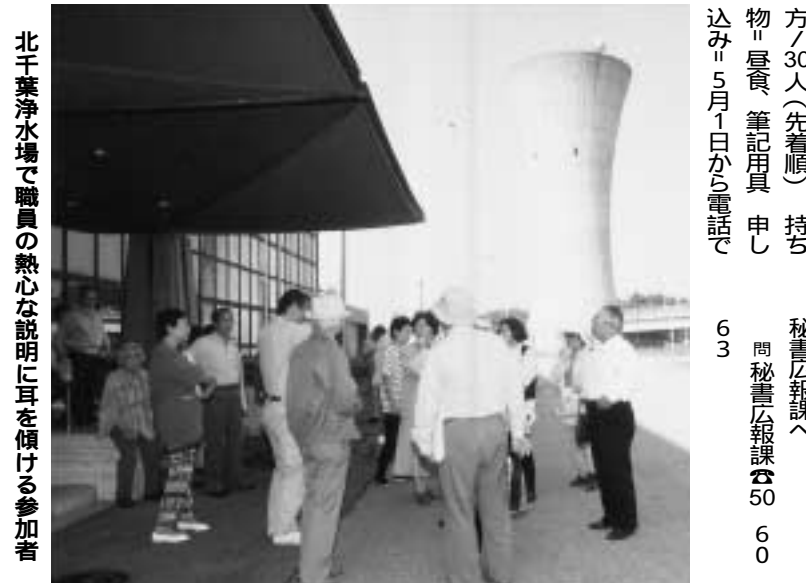
北千葉浄水場で職員の熱心な説明に耳を傾ける参加者

市内施設見学会を今月十九日に開催します。私たちがふだん、何気なく蛇口をひねって使っている水。収集した後、ごみの行方は、など日常生活にかかわりのある市内の施設、北千葉浄水場や清掃事務所などをバスでぐるりと見学します。