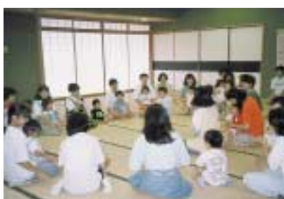
親子クッキングスクール(右)や母子のつどい(左)なども活動の中心