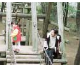
山近隣公園 三輪野山292 面積 = 約2.8ha