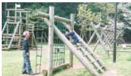
5 東部近隣公園 所在地 = 名都借240 面積 = 約1.8ha 運動のできる芝生広場と木製の遊具が魅力。林の中には遊歩道も整備されている

市民の憩いと安らぎの場として、市内には公園や緑地が三百十か所以上、面積にすると百ヘクタール近くあります。公園の大きさや形はさまざまですが、それぞれの公園ごとに工夫を凝らした作りになっています。どんな違いがあるのか比べて見るのも面白いですね。