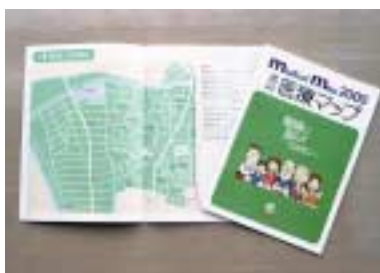
地域の医療機関を掲載した「医療マップ」