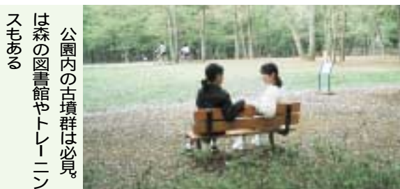
東深井地区公園 所在地 = 東深井815 面積 = 約6.7ha