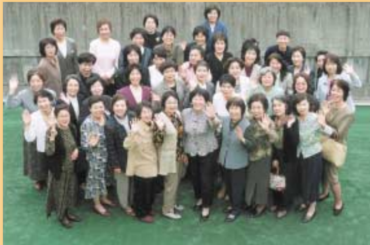
勢ぞろいした「健康づくり推進員」の皆さん