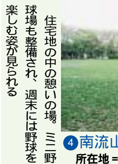
住宅地の中の憩いの場。三三野球場も整備され、週末には野球を楽しむ姿が見られる。