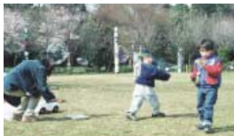
1 総合運動公園 所在地 = 野々下1-40-1 面積 = 約17.9ha 充実したスポーツ施設のある市内最大の公園。園内には87基のトーテムポールが立つ

市民の憩いと安らぎの場として、市内には公園や緑地が三百十か所以上、面積にすると百ヘクタール近くあります。公園の大きさや形はさまざまですが、それぞれの公園ごとに工夫を凝らした作りになっています。どんな違いがあるのか比べて見るのも面白いですね。