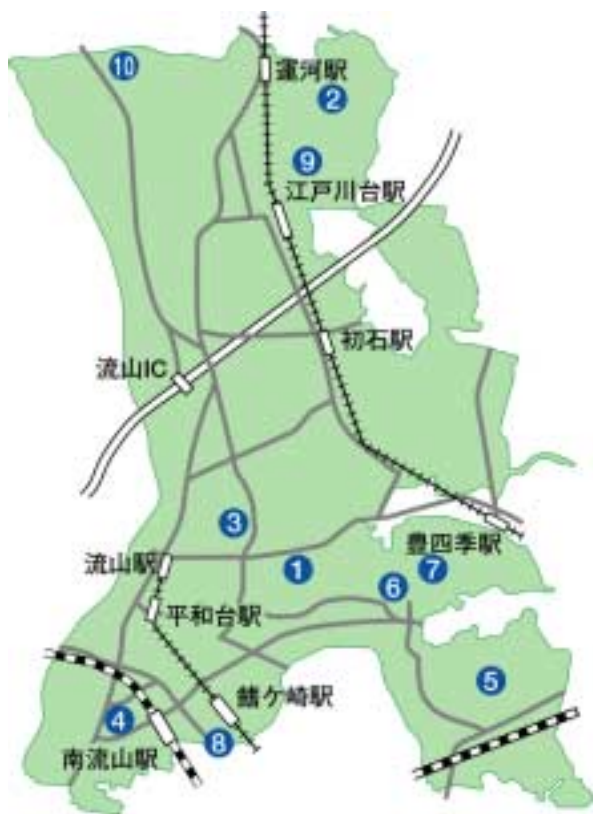
記事中の番号はこの地図の番号に対応しています