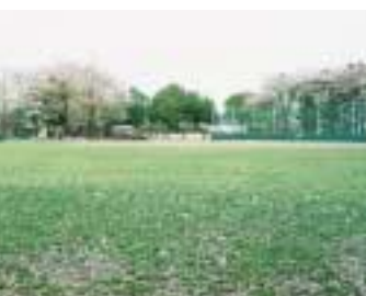
中央公園 南流山3・14 面積 = 約1.2ha