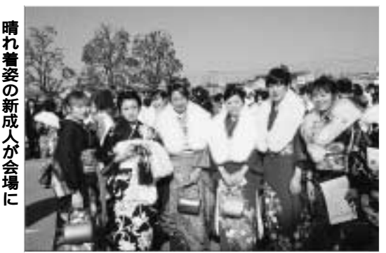
晴れ着姿の新成人が会場に

穏やかに晴れ渡った二月十四日、成人式実行委員会による手作りの成人式が行われ、会場となった文化会館は、艶やかな晴れ着姿や新しいスーツ姿の新成人で埋め尽くされました。