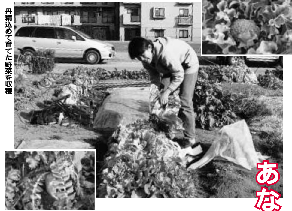
丹精込めて育てた野菜を収穫

式典では、来賓からお祝いの言葉が贈られました。また、式典の後、ホールのスクリーンに中学校時代の恩師からのお祝いビデオメッセージが次々と映し出されるたびに、客席からは「わあ、懐かしい」「変わらないね」などと声が上がりました。会場内では、「元気?」「久しぶり」といった声があちらこちらで聞かれ、久しぶりに会った友人と記念写真を撮ったり、携帯電話の番号やメールアドレスを交換したりする姿も多く見られました。