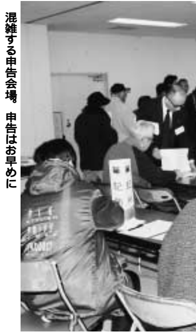
混雑する申告会場 申告はお早めに

所得の有無にかかわりなく 市・県民税の申告書は、所得の有無にかかわらず、所得がない場合は、保育園の入園申請をする際に必要になる税関提出された申告書は、国民健康保険の際の基礎資料にもなります。 なお、申告は郵送でも受け付けられます。 【送付先】 〒270-0192 流山市役所