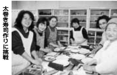
大巻き寿司作りに挑戦

「ういはん」の良さを見直そう 毎年好評の大巻き寿司教室を、ことしも二月二十日に市内三会場で開催します。 この教室は、日本人の主食の「ごはん」の良さを見直してもらい、もつとお米をたくさん食べてもらおうと、市農家生活研究会の方を講師に招いて行われるものです。 あなたもこの教室に参加して、色鮮やかな絵柄の大巻き寿司を作ってみませんか。 日時：2月20日(水)10時～14時 会場：①南流山センター ②初石公民館 ③東部公民館 対象/定員：市民/各30人(多数抽選) 参加費：500円 申し込み：往復八ガキに「大巻き寿司教室参加希望」、住所、氏名(ハガキ1枚につき1人)、電話番号、希望会場を明記(返信用にも住所、氏名を記入)し、1月31日(必着)までに〒270 019 2流山市役所農政課へ 問農政課☎50 6086