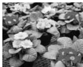
今が見ごろの「プリムラ」

一つ、高校生活で大切な上級生と下級生の交流の場にもなっているようです。花栽培の実習を通して、上級生と下級生が交流を深めていく中で、二年生は三年生から、綺麗な花を咲かせるためのコツと共に、「花を思う温かい心」を自然に身に付けるのでしょう。