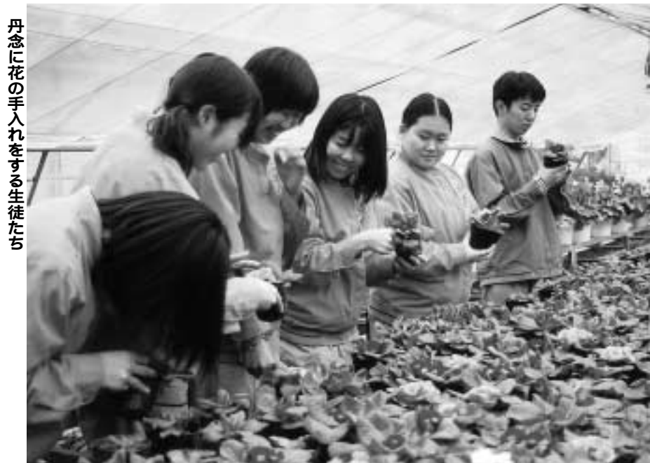
丹念に花の手入れをする生徒たち

流山高校の卒業式は、二・三年生が一緒に育てたこのサイネリアの花が三年生の新しい門出を美しく飾ることでしょう。