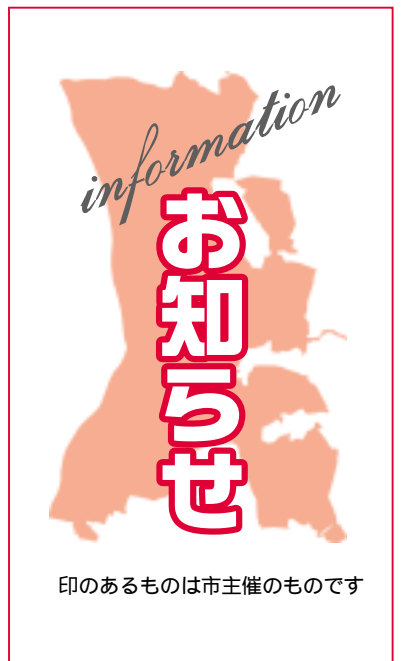
印のあるものは主催のものです