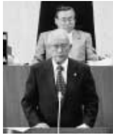
一般報告をする市長