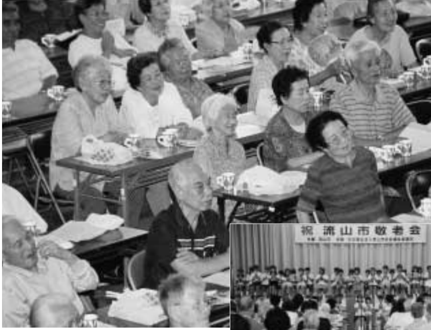
舞台の演奏や演技に見入る参加者の皆さん