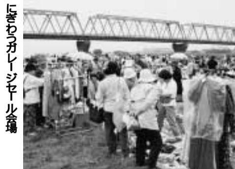
にぎわうガレージセール会場

日時 = 10月13日(土)9時~14時(雨天の場合は、10月20日(土)に順延) 場所 = 江戸川河川敷多目的広場 出店対象 = 市内在住者(商業者の出店は不可) 募集出店数 = 250店(抽選・当選者には申請書等を9月29日ごろまでに郵送) 出店料 = 無料 出品できるもの = 書籍、衣類、おもちゃ、電化製品等の日常生活用品 食料品や動物は不可 申し込み = 官製ハガキに「ガレージセール出店希望」、住所、氏名(フリガナ)、電話番号を明記し、9月21日(必着)までに、〒270-0192流山市役所リサイクル推進課へ 電話や重複申し込みは不可 問リサイクル推進課 ☎50-6084