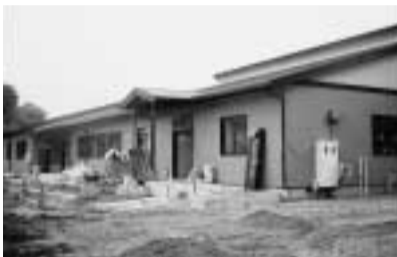
10月1日オープン予定のグループホーム「わたしの家」

痴ほう性高齢者のグループホームは、九月十五日に完成し、十月一日に開所できる見通し