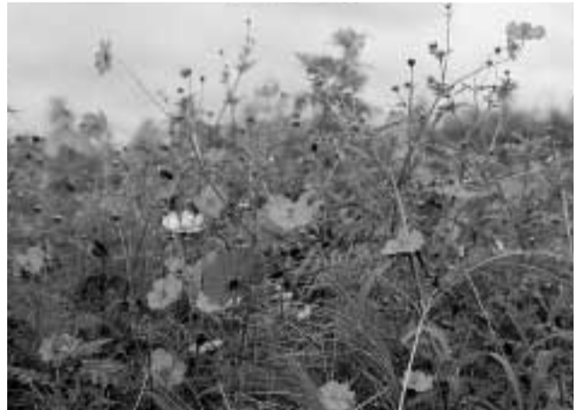
秋風に揺れるコスモス

秋空に彩りを添えるコスモス。地域の景観形成の向上に努めようと、休耕田を利用して種をまいたコスモスが見頃となりました。さわやかな秋風を受けながら、ぶらりと立ち寄ってみてはいかがでしょうか。 問 農政課 ☎50-6086