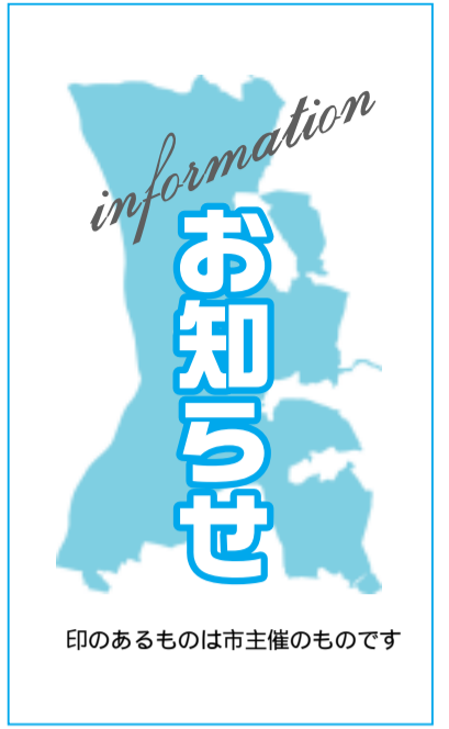
印のあるものは市主催のものです