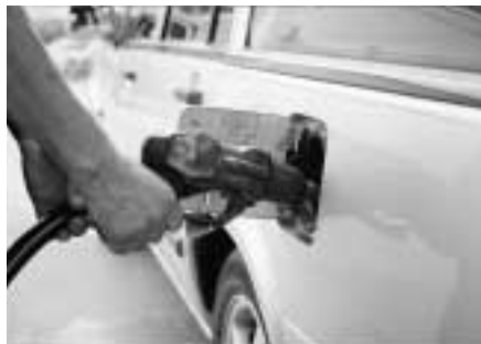
給油には細心の注意を

最近、市内でも見かけるようになったセルフ式のガソリンスタンド。 このセルフスタンドで静電気が原因と見られる火災が全国で二件発生しています。