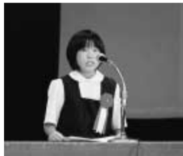
私たちの意見を聞いて...