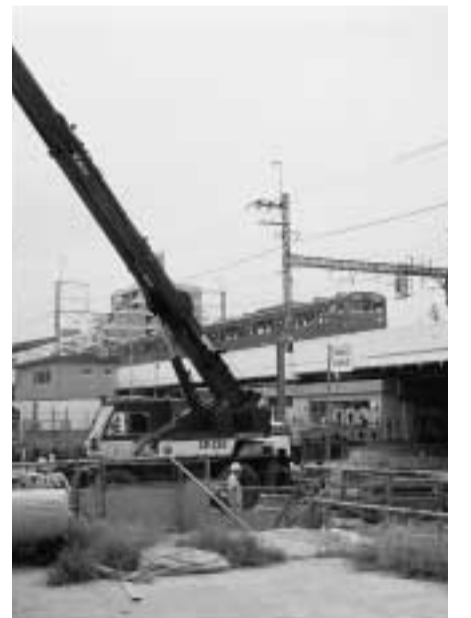
工事が進む南流山駅周辺

このように市内各所で、鉄道工事が展開されています。市としては、今後とも安全確保を最優先で工事を進めるよう、鉄道建設公団に強く要請してまいります。