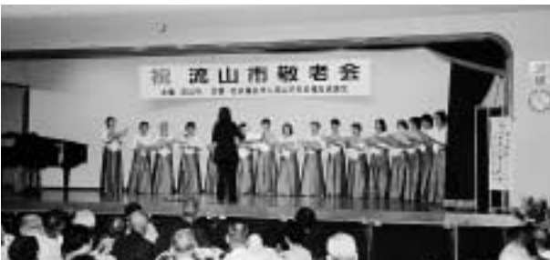
楽しい催しものが盛りだくさんの敬老会

対象は、昭和六年九月一日までに生まれた七十歳以上の方です。対象者には、招待状を郵送しますので、当日持参のうえ、「出席ください」。なお、対象となる方で招待状が届かない場合には、高齢者支援課へ連絡してください。 問 高齢者支援課 ☎50 6080