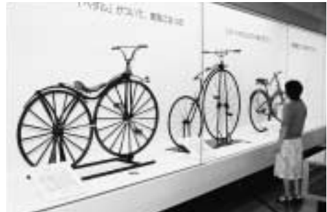
企画展にも足を運んでみては

企画展も好評開催中 四月にリニューアルオープンした市立博物館で、「流山と自転車」をテーマに企画展を開催しています。 期間：9月16日(日)まで(月曜 祝日、8月31日を除く) 時間：9時30分～17時 場所：市立博物館 入場料：無料