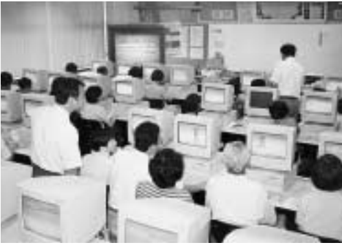
学校開放講座でパソコンの基本操作の習得

日程 7月24日(火)・27日(金)・30日(月) 時間 いずれも14時～16時(13時30分開場) 会場 南部中学校 北部中学校 常盤松中学校 八木中学校 東部中学校 東深井中学校 南流山中学校 西初石中学校 対象/定員 18歳以上の市内在住・在勤の方/各35人(多数抽選) 受講料 無料 申し込み 往復八ガキに住所、氏名、性別、年齢、電話番号、希望会場を明記し、6月14日(必着)までに〒270-0192流山市教育委員会指導課「学校開放講座」係へ