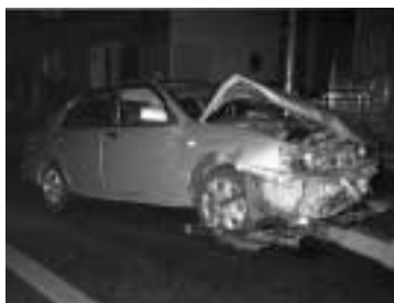
夜間の走行には要注意!

交通事故死 ことしに入りワースト一 平成十二年中の千葉県内の交通事故による死者数は、全国ワースト三位でした。事故発生件数三万七千九百七十九件に対し、負傷者数は四万八千三百二十五人を数え、四百十六人もの尊い命が失われました。市内でも、七百二十七件の事故が発生し、九人が亡くなられています(下表参照)。 平成十三年に入り、県内で交通事故で亡くなられた方はすでに百六十八人(五月二十七日現在)にのぼり、残念ながら全国ワースト一位になっています。事故は、午後四時