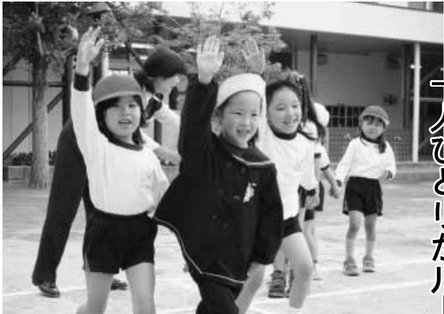
交通安全指導を受ける園児たち