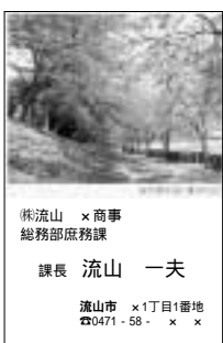
「桜の散策道」と題した名刺台紙

流山の名所で本市のPRをすることは、市観光協会では「運河の桜」がカラー印刷された名刺用台紙の販売を行っています。この台紙は、市の素晴らしい景色をPRするため、今年度から市民向けに始まったもので、利根運河堤に咲く満開の桜のトンネルの写真が縦位置上部に印刷されているものです。