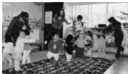
お母さんと楽しく踊る子どもたち(子育て支援センター「ゆうゆう」で)

【子育て支援センター「ゆうゆう」】 長崎保育所内に設置されている子育て支援センター「ゆうゆう」でも、子育てに関する相談に応じるなど、皆さんの子育てを応援しています。