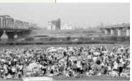
真剣に取り組む参加者

毎回好評の「ガレージセール」を5月26日、江戸川河川敷多目的広場で開催します。市民による出店数は250店を予定。持ち寄られる品物は、書籍、衣類、おもちゃ、食器、電化製品など掘り出し物でいっぱいです。この「ガレージセール」は、ごみの減量や資源の有効利用を目的に開かれており、市民におなじみのリサイクルイベントとなっています。