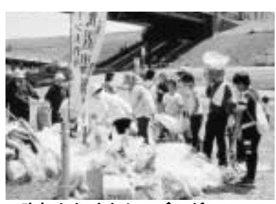
昨年もたくさんのごみが...

【江戸川クリーン大作戦】四会場(運河水辺公園、利根運河江戸川出口、富士橋、江戸川河川敷野球場)を拠点に、江戸川の河川敷などを広範囲にわたり清掃します。参加者は、五月二十七日午前九時までに、いずれかの会場に集合してください。約一時間、河川敷の清掃を行います。なお、十人以上の団体で参加される場合は、事前に環境保全課にご連絡ください。【ゴミゼロ運動のみ雨天の場合は六月三日に順延し、両日雨天時は中止。江戸川クリーン大作戦については、順延日はありません。】