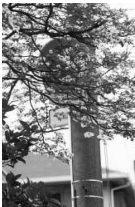
伸びた枝で、道路標識が見えません

私たちの暮らしに欠かすことのできない道路。何気なく利用していますが、道路にはみ出した木の枝や民家の生け垣に「危ない」と感じたことはありませんか。