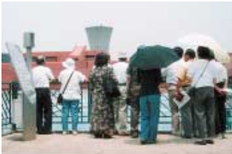
北千葉浄水場も見学

市内施設見学会を今月18日に開催します。私たちが普段、何気なく蛇口をひねって使っている水はどこから。収集した後のこ