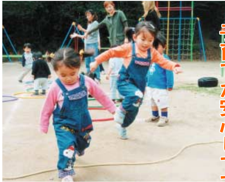
次代を担う子どもたちが健やかに育つことが私たちの願い