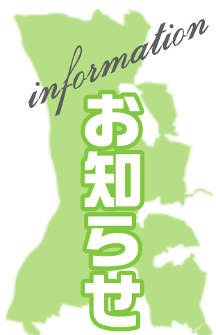
印のあるものは市主催のものです