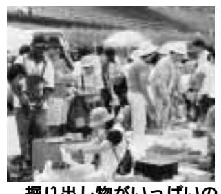
掘り出し物がいっぱいのガレージセール