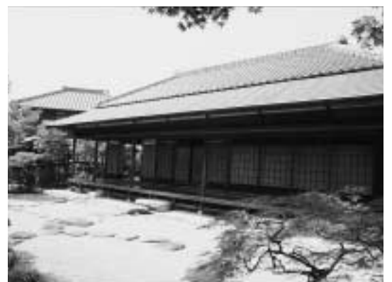
コンサートが行われる一茶双樹記念館の双樹亭

日時 = 5月12日(土)15時~ 場所 = 一茶双樹記念館 対象/定員 = 市民(小・中学生は保護者同伴)/60人(先着順) 曲目 = 長等(ながら)の春、数え唄、瀬音ほか 演奏 = 市邦楽三曲会 入場料 = 無料 申し込み = 電話で一茶双樹記念館へ 問一茶双樹記念館 ☎50 - 5750