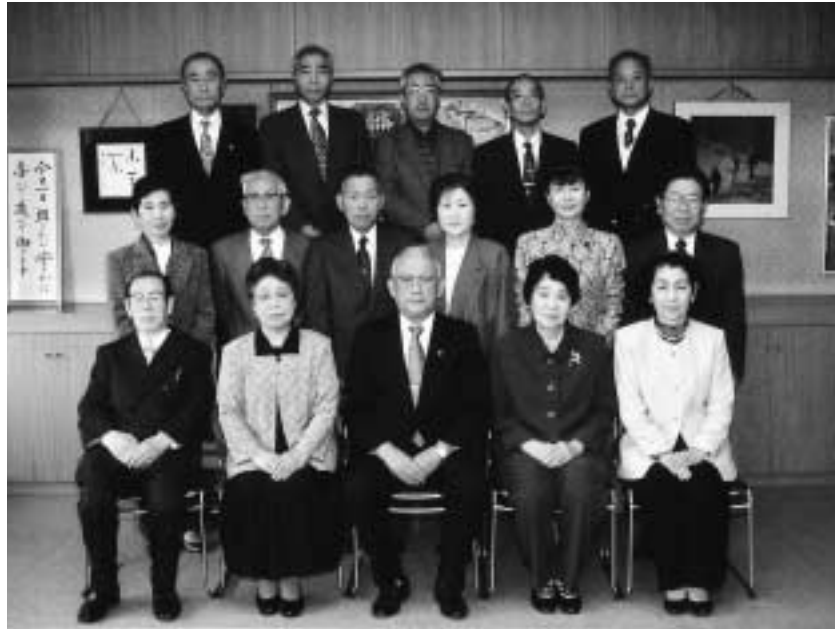
表彰式に出席した功労者の皆さん

期間 = 4月から平成14年3月まで(日曜、祝日、学校休業日を除く) 時間 = 9時~16時 第1・3土曜は11時まで 開放施設 = 教育活動に支障のない余裕教室、会議室など 申込方法 = 学校にある指定の申請書に必要事項を記入し、使用希望日の2日前までに学校に提出 営利・政治・宗教活動等には使用できません 問指導課 ☎50 - 6105