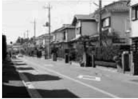
目にもやさしい緑をまちに