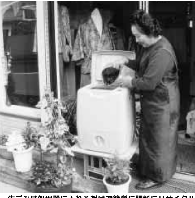
生ごみは処理器に入れるだけで簡単に肥料にリサイクル

皆さんのお宅では、毎日、食事を作る際などに出る「生ごみ」をどのように処理していますか。可燃ごみとして処理している方も多いのではないのでしょうか。市では、ごみ減量・資源化が気軽に家庭でもできるよう、生ごみ肥料化処理器購入補助金制度を設けています。さらに、同処理器を利用しやすくするため、今月購入分から、その補助率を千葉県下の市町村でもトップクラスの補助率に大幅アップしました。