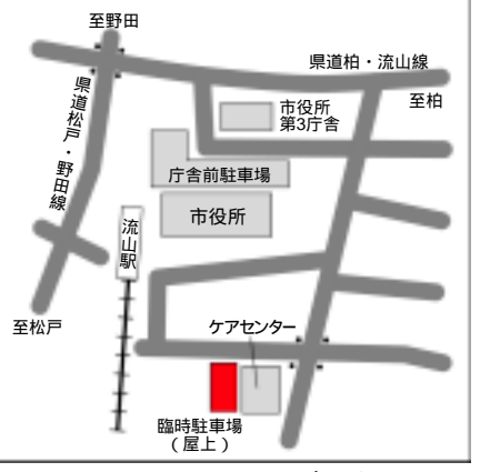
利用期間と時間にはご注意ください

確定申告の時期は、市役所の庁舎前駐車場が大変込み合うことから、臨時駐車場(右図参照)を開設します。確定申告等で、駐車時間が長くなる方は、臨時駐車場を利用するようご協力ください。利用期間 = 2月17日～3月17日(土・日曜を除く) 利用時間 = 8時30分～17時20分 利用時間以外は施設しますのでご注意ください。問 管財課 ☎7150 - 6069