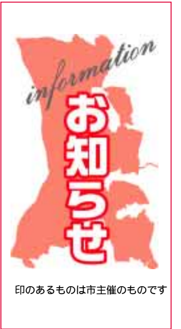
印のあるものは市主催のものです