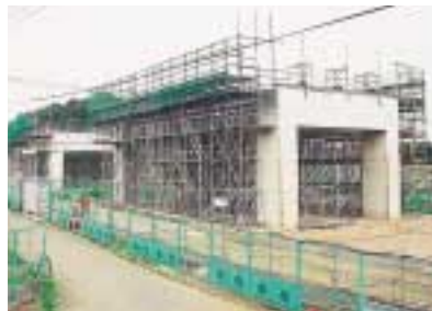
(仮称)流山運動公園駅の工事進捗状況

(仮称)流山運動公園駅については、「流山運動公園」、「流山中央」、「新流山」、「流山公園」などの意見が多く(仮称)流山新市街地駅については、「流山中央」、「新流山」、「北流山」などの意見が多くありました。