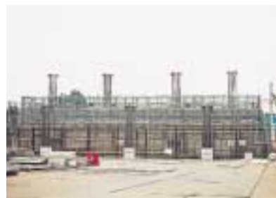
(仮称)流山新市街地駅の工事進捗状況