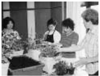
昨年のガーデニング講習会の様子

花や緑にもっと親しんでもらおうと、「観葉植物の涼しげ寄せ植え」をテーマにガーデニング講習会を開催します。この講習会は、都市緑化推進運動の一環として毎年開催しているもので、実際に体験しながらガーデニングの基礎を学びます。