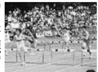
スタンドの声援を受けて力走する選手たち