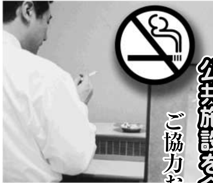
公共施設の分煙機器も7月には撤去

市役所、出張所、消防署、保健センター、ケアセンター、福祉会館、コミュニティホーム、コミュニティプラザ、保育所、市立幼稚園、小・中学校、文化会館、公民館、図書館、博物館、総合運動公園・体育館、水道局など