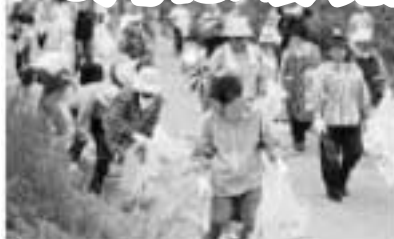
6月1日行われた「江戸川クリーン大作戦」。地元自治会など多くの市民が参加し、1時間程で空き缶や散乱ごみなど、約11トンのごみを拾いました。参加者の皆さん、お疲れ様でした。

一人ひとりのちょっとした心遣いで、快適な居住環境をつくることができます。音響機器などの生活騒音の抑制 飼育犬のフンの後始末 ごみのポイ捨て防止 家庭排水の浄化対策 停車中の自動車アイドリングストップ など、環境に配慮した生活を心掛けましょう。 問環境保全課☎7150-6083