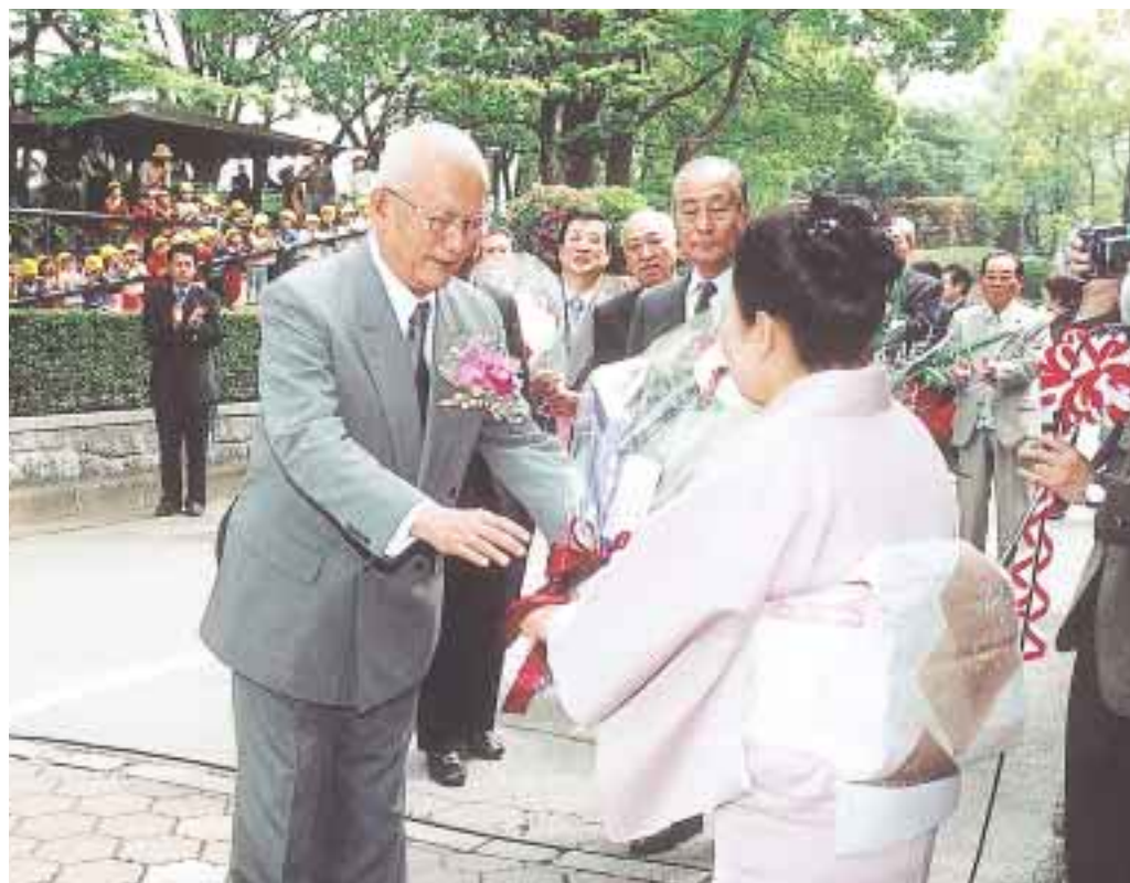
市民から贈られた花束を手に市庁舎を後にする眉山前市長