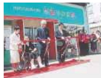
五月晴れの下で行われた式典

「茶話やか広間」が江戸川台にオープン 「何かにつけてストレスの多い世の中。ふれあうことで息抜きませんか」とNPO 法人流山ユート・アイネットは五月一日に「茶話やか広間」をオープンしました。「おしゃべりやお茶する中で、ストレス解消や情報交換ができれば」と皆さんの利用を呼び掛けています。 また、この施設で利用者のお世話をするボランティアも随時募集しています。 利用日時 月 金曜10時~16時 場所 江戸川台郵便局前(市役所江戸川台出張所隣) 対象 ふれあいを望む方、どなたでも(高齢の方、介護している方、障害を持つ方、子育てママなど) 利用料 1回200円 囲碁 将棋 麻雀 トラ