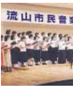
日ごろの成果を披露

フルートアンサンブル 花音 (カノン) アンサンブル・ヴィヴァーチェ 音楽を楽しむ会 「トラス」彩 流山童謡を歌う会 美しが丘女声合唱団&トル・レインボー ルシ