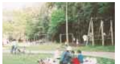
東部近隣公園(地図E)