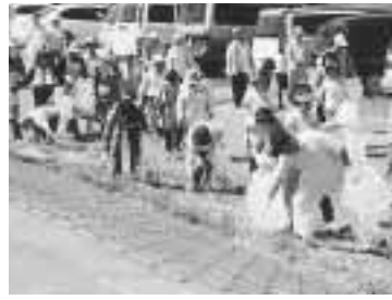
昨年の江戸川クリーン大作戦

「自分たちの住むまちを自分たちできれいにしよう」と、市民の皆さんにもすっかり定着した「ゴミゼロ運動(地域の日清掃)」が、六月一日を中心に行われます。