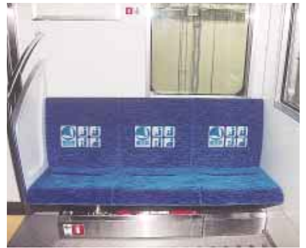
一般席と色を変え、背もたれには「優先席」のマークを表示