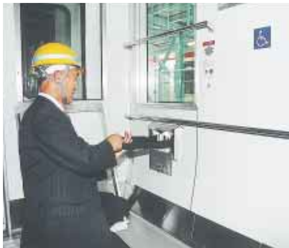
車いすを固定するベルトを車内に設置