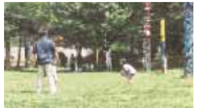
市総合運動公園(地図A)

各種のスポーツ施設がある市の代表的な公園。園内にはいるとどりのトーテムポールが立つ広々としたピクニック広場がある