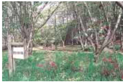
愛宕ふれあいの森(地図C)