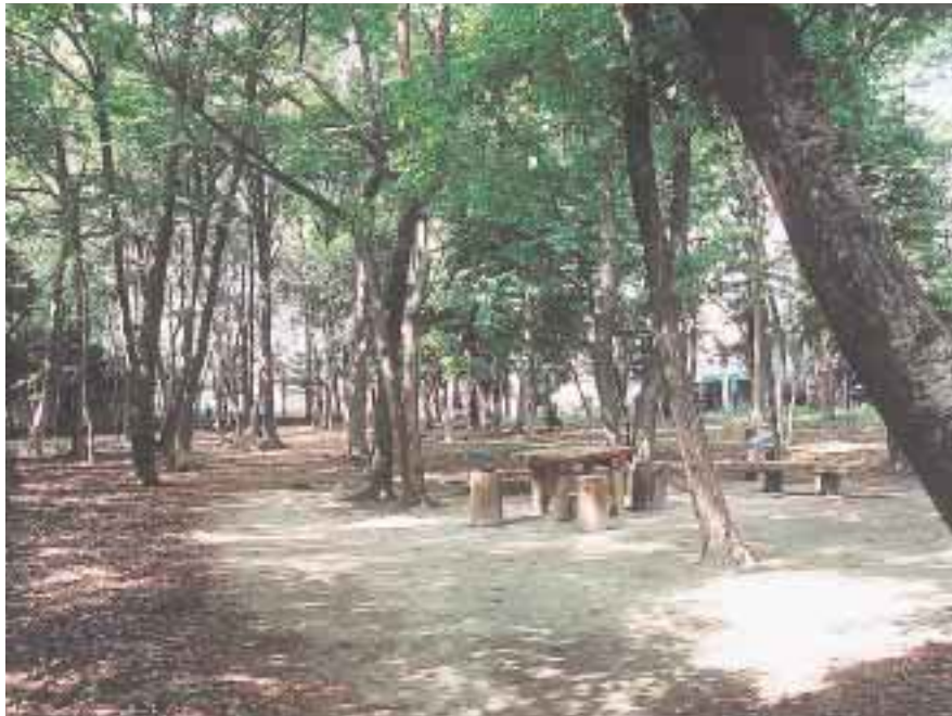
西初石ふれあいの森(地図B)