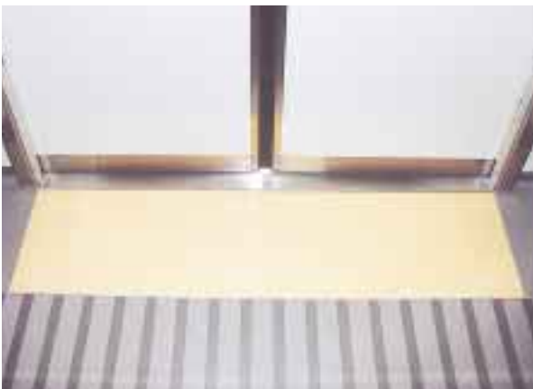
出入り口が分かりやすいように車両内のドア床下を色別

平成十七年秋の開業に向けて、つくばエクスプレスの鉄道工事が着々と進む中、試験走行が実施され、また、特別に四月二十九日に車両も一般公開されました。 車両の外観は、つくばエクスプレスの特色である「速い鉄道」をイメージして、スピード感のあるシャープな先頭デザインとし、鉄道と沿線地域を一体化した「進化する鉄道・進化する街」にふさわしいスマートなデザインとなっています。 客室は、バリアフリーへの配慮に加え、開放感のある洗練されたインテリアをイメージして、明るく清潔感のあるものとなっています。