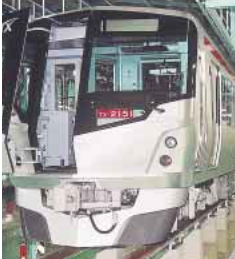
地下も走行するため、正面貫通扉があります(上)