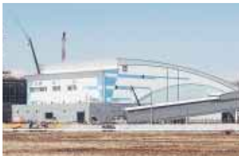
工場棟のリサイクル館

環境にやさしい循環型社会を目指した施設「リサイクルプラザ」がきょう下花輪にオープンします。 資源物を分別処理する工場棟の「リサイクル館」と、ごみの減量や資源化についての学習や実習が行える啓発棟の「プラザ館」の二棟からなる施設です。