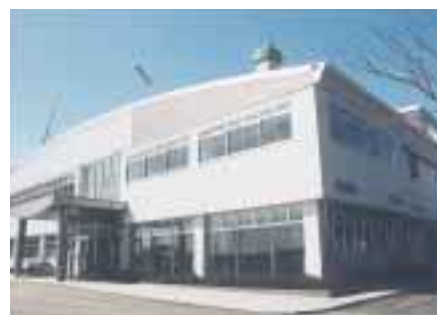
研修室や工芸室を備えたプラザ館