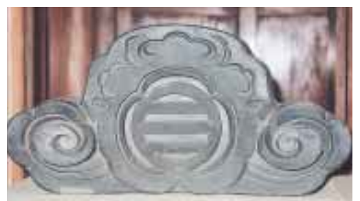
一茶双樹記念館に展示されている秋元本家の鬼瓦

秋元本家と柴又の鈴木家は、縁戚関係もあった。鈴木家から嫁にきたり、秋元家から婿に行ったりしているそう。それは、両家が似た家柄だったからだろう。どちら