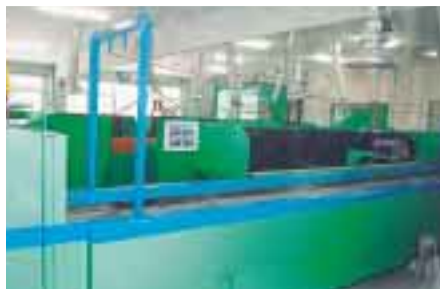
3月27日に行われた竣工式(上)とリサイクル館内のペットボトル手選別コンベア(左)