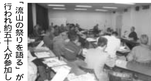
「流山の祭りを語る」が行われ約五十人が参加しました。写真。

この大会は、子どもたちも季節の伝統行事を知ってもらうとともに、地域のコミュニケーションの輪を広げるために、平成元年から毎年行われているもので、ことしで十七回を数えます。当日は、近所の子どもたちや氏子らが見守る中、神社総代や町会長、自治会長ら六人が「福は〜うち」の掛け声とともに参拝客に豆をまきました。境内の一角では、根